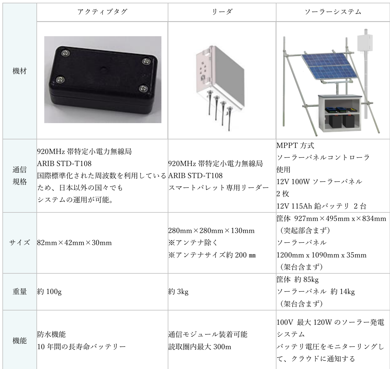
※1： 920MHz 帯アクティブ RF-ID タグとリーダー

J.C.O.S とユーピーアールは、アクティブ RF-ID タグ技術を活用して、今回のレンタル車両の監視サービスのみならず、様々な領域において、物流と IoT を融合した「Logistics4.0」 ※2 の実現を目指します。